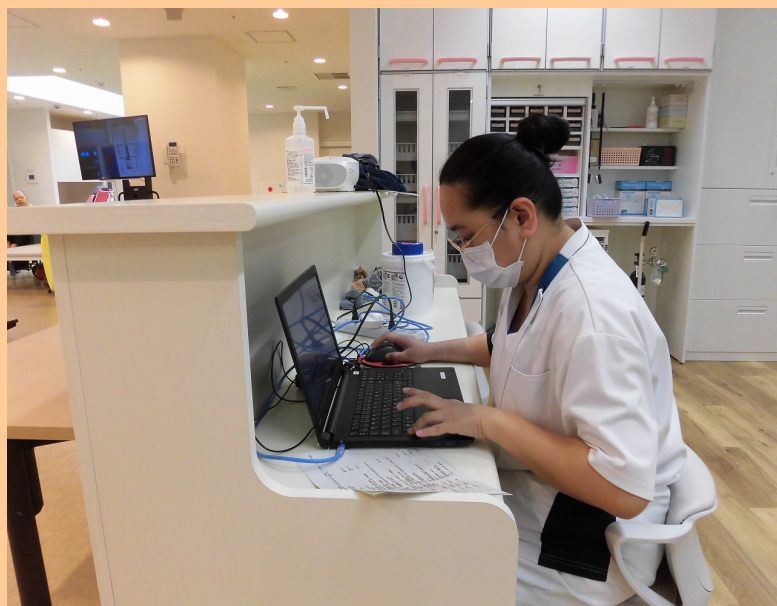
外国人労働者の挑戦（P 4 掲載）