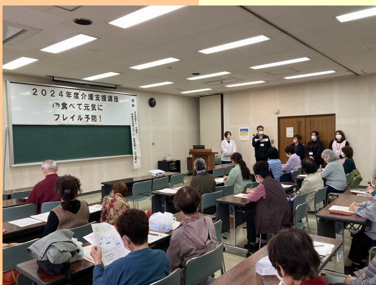
事業所トピックス 介護保険支援センター青嵐荘(総和)より（P 7 掲載）